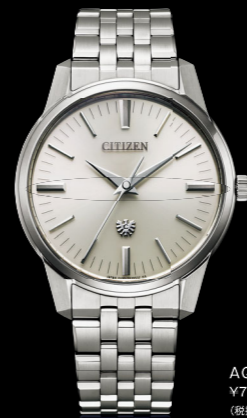
AQ6100-56A ¥770,000 税込 (取扱価格 ¥700,000)