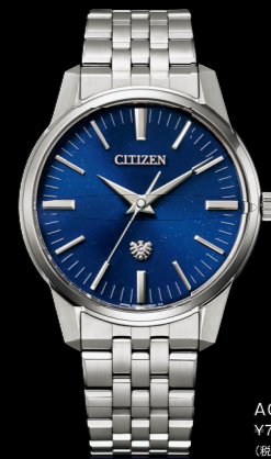
AQ6100-56L ¥770,000 税込 (取扱価格 ¥700,000)